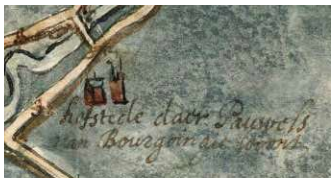
Zijn hofstede in de Maldegemse polder nabij Lapscheure, detail (RAB, Kaarten en plannen, 551)

In nog een andere handschriftelijke kaart zien we ook zijn hofstede aangeduid: