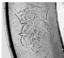
Afb 4 en 5