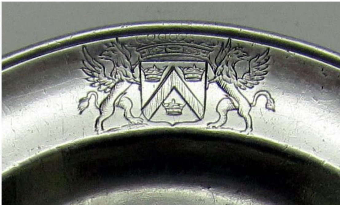
Afb 1 Schild met keper en drie kronen, overtopt door een kroon en met twee schildhouders.

In de catalogus "Iepers gegraveerd tin" vinden we onder de nrs. 47, 48 en 49 een familiewapen met schildhouders en een kroon. [afb 1]