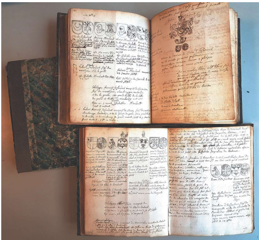
HF 23, delen 1 en 2, HF 24