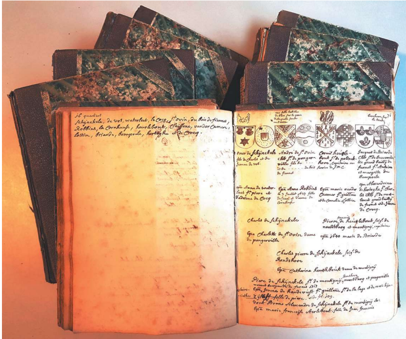
HF 20, delen 1 tot 8