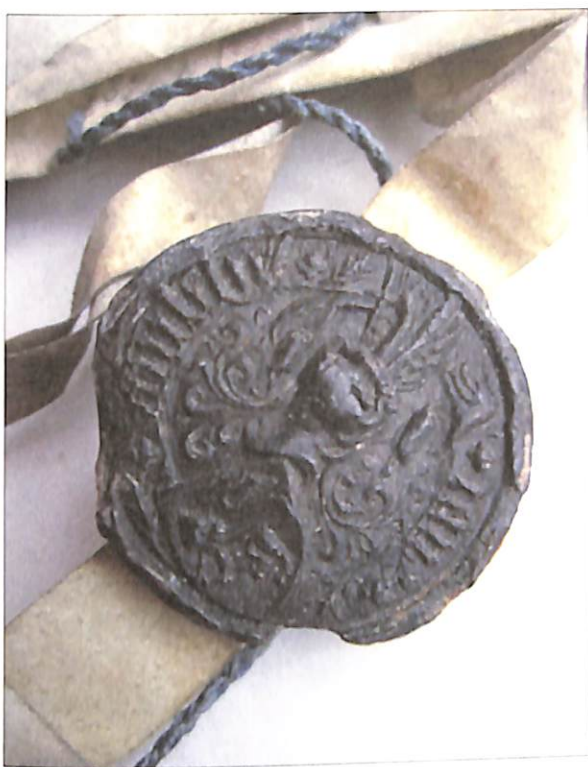
Zegel van J. Knibbe, 1440.

Talloos zijn ook de vermeldingen van een Knibbe in allerlei andere ambten in de kasselrij en stad, zoals klerk, raadspensionaris (een jurist in vaste dienst), krikhouder (permanent secretaris), kerkmeester (bestuurder in een kerkfabriek) of dismeester (bestuurder van de armendis), notaris, ontvanger (van issuwe-rechten of van het goed van overleden bastaards), deurwaarder, enzovoort... of baljuw van een heerlijkheid. Onvermijdelijk waren er ook Knibbes die gingen wonen in de aangrenzende kasselrijen of naburige steden en die daar ook lokaal politiek actief waren, zoals in de kasselrijen Ieper, St.-Winoksbergen (thans in Frankrijk: Bergues (-Saint-Winoc)) en het Brugse Vrije, of in de steden Nieuwpoort, Lo, Poperinge, Diksmuide en Lombardsijde.