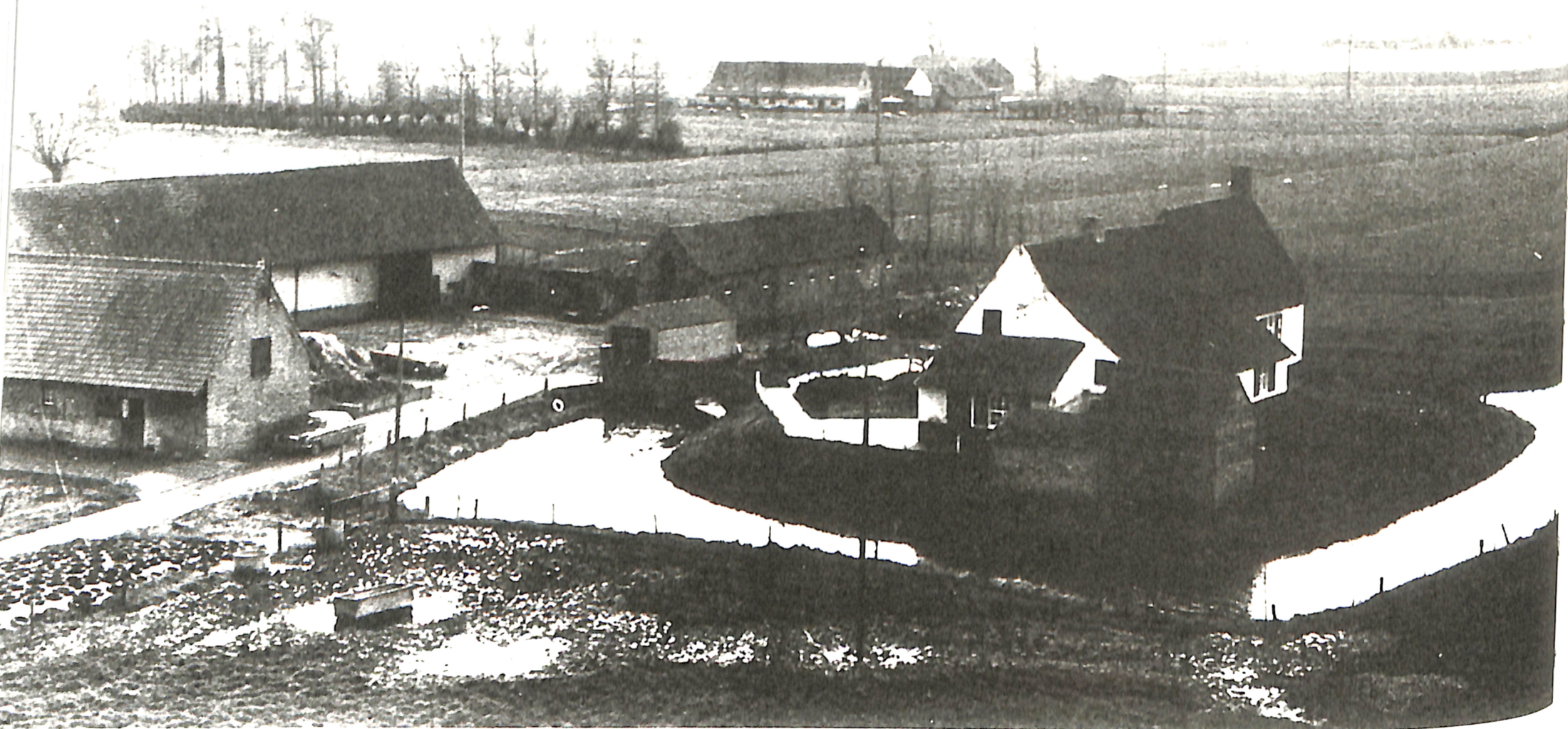
Hoeve met walgracht in Oeren (in de volksmond Hoeve Sissau), Oerenstraat 20, Oeren (Alveringem). De hoeve is omgeven door een walgracht. Het is een middeleeuwse motehoeve met een omwald opperhof en een neerhof. Beide zijn verbonden via een boogbrug. De walgracht had, naast beveiliging, vooral een statussymbolische functie. Foto genomen vanaf de kerk van Oeren, maar in 1982 was de hoeve nog niet omringd door bomen, deze is nu wel omgeven door bomen, onder andere populieren achter het woonhuis.