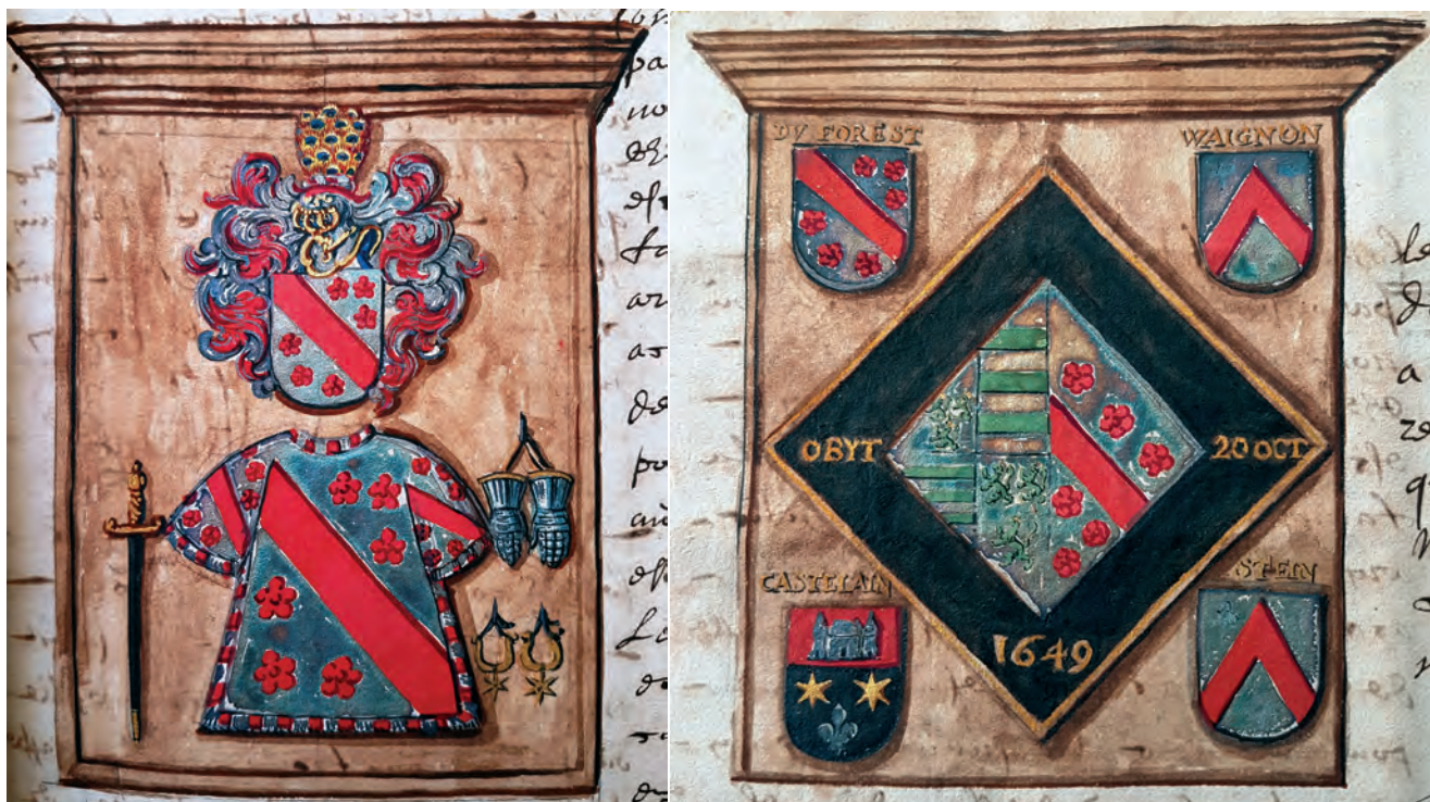
Links: Rijsel, St.-Etienne: ridderkabinet du Forest (f° 39). Rechts: wapenbord van een vrouwenwapen de Lannoy – du Forest († 1649) met kwartierschilden du Forest, Castelain, Waignon en Stein (f° 39v).

getuigenverhoren en plaatsbezoeken te initiëren. Mogelijk had hij deze pauze nodig voor voorbereidend onderzoek en het zoeken van geschikte getuigen. Voorbereidend onderzoek is misschien ook de verklaring voor de lange periode van zeven maand tussen de procuratiegeving op 9 mei 1679 in Cádiz aan Robert de la Vilette en de start van het onderzoek eind januari 1680: misschien had Robert de la Vilette al in de loop van 1679 Jacobus Antonius Kerchhof mondeling erover gepolst, waarop deze de haalbaarheid onderzocht en informeel voorbereidend onderzoek deed naar de paternele voorouders van don Pedro. Eenmaal de opdracht haalbaar geacht en zijn aanvaarding van de opdracht medegedeeld kon de la Vilette de procedure formeel opstarten, iets wat amper enkele dagen (13 tot 17 januari) tijd vergde.