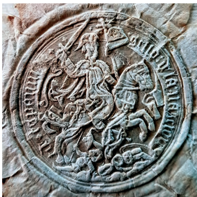
Zegel van de Spaanse Natie te Brugge, 1680 (f° 3).

Het formele onderzoek ging daarna meteen van start en gedurende tien maanden werden 20 getuigen onder ede ondervraagd over de voorouders van don Pedro, werden parochie- en kloosterkerken bezocht in Doornik, Rijsel, Duinkerke en Mechelen op zoek naar heraldische voorstellingen en werden akten opgezocht en gekopieerd 1 . Het resultaat van alle opzoekingen was een cahier (24 x 35 cm) van 170 bladzijden (ii + 82 folio's) met tal van akten ondertekend door een schare van ambtenaren, met 14 officiële zegels van instanties en vele, zeer verzorgd uitgevoerde heraldische il-