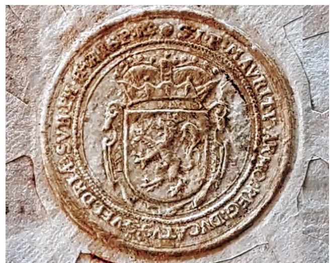
Ambtszegels van de wapenherauten Vlaanderen (boven) en Gelderland (onder) (f° 80).