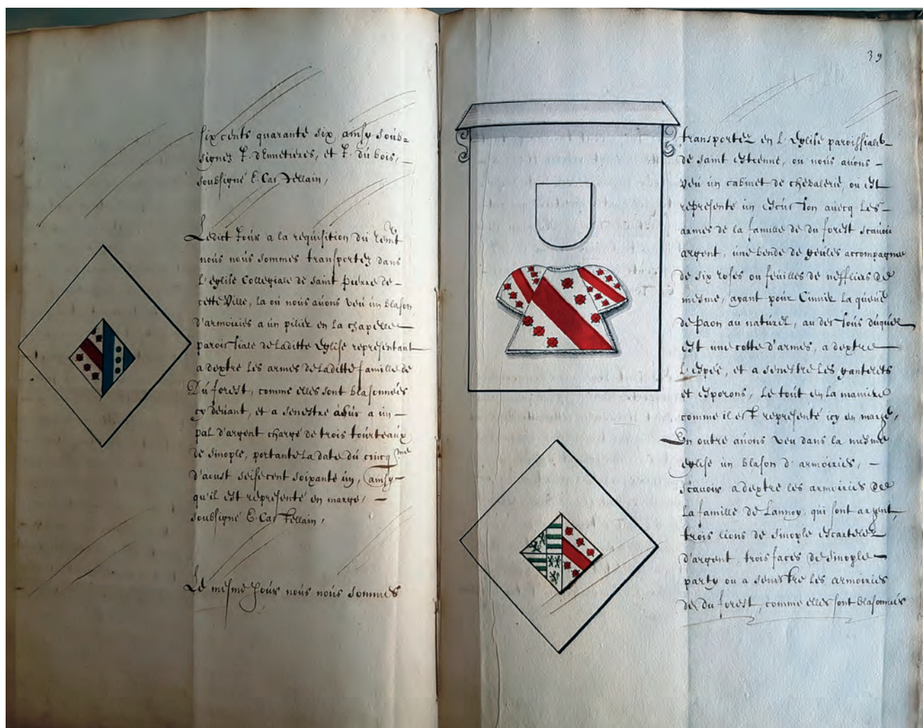
Sobere tekeningen van familiewapens en ridderkabinet in de kopie Livre ... (f° 38v-39r).