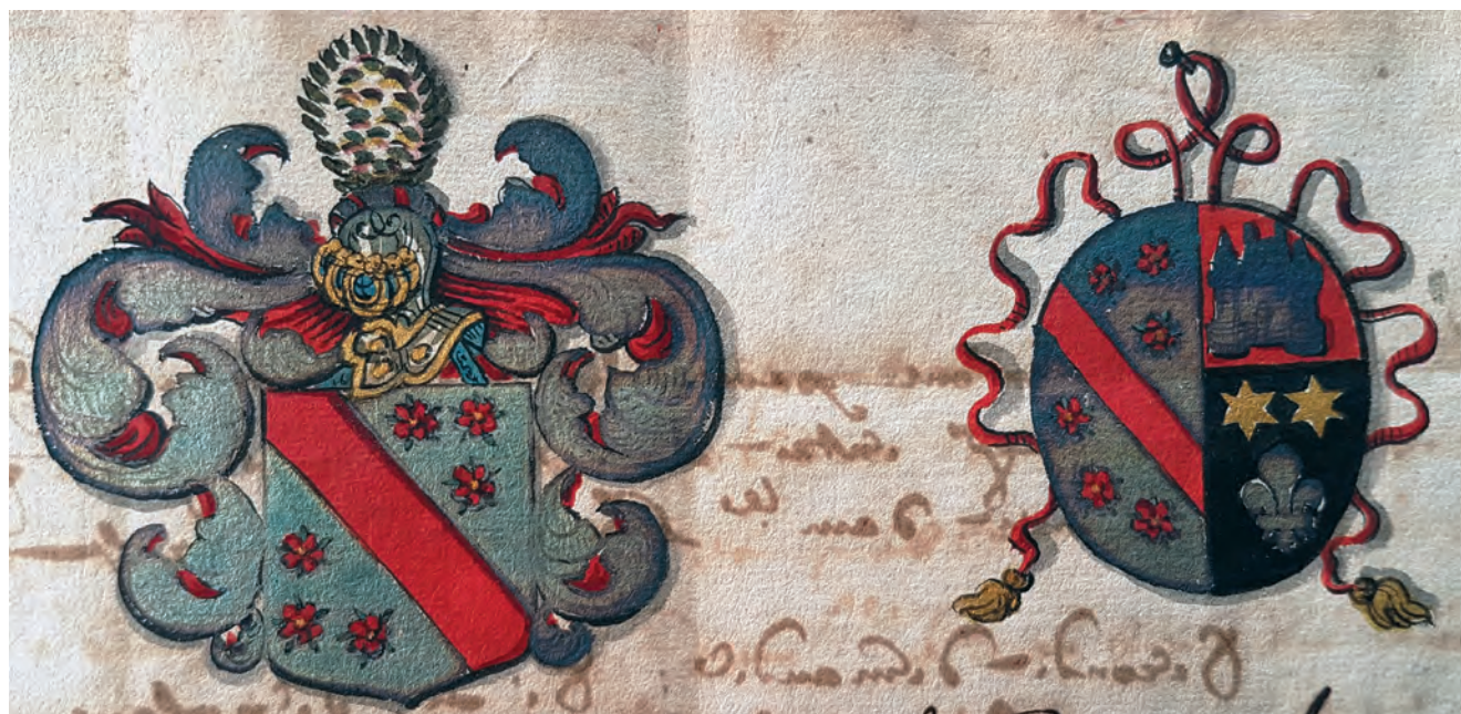
Boven: wapens Pierre du Forest en Marguerite de Castelain (f° 25). Onder: rouwbord van een vrouwenwapen ? - du Forest (†1661), Rijsel, St.-Pieters (f° 38v).

voor betreffende de vaststelling van edele afstamming van Antoine du Forest, een andere achterkleinzoon van Pierre du Forest en Marguerite Castelain en die deze had gebruikt om vrijstelling te bekomen van een bepaalde belasting.