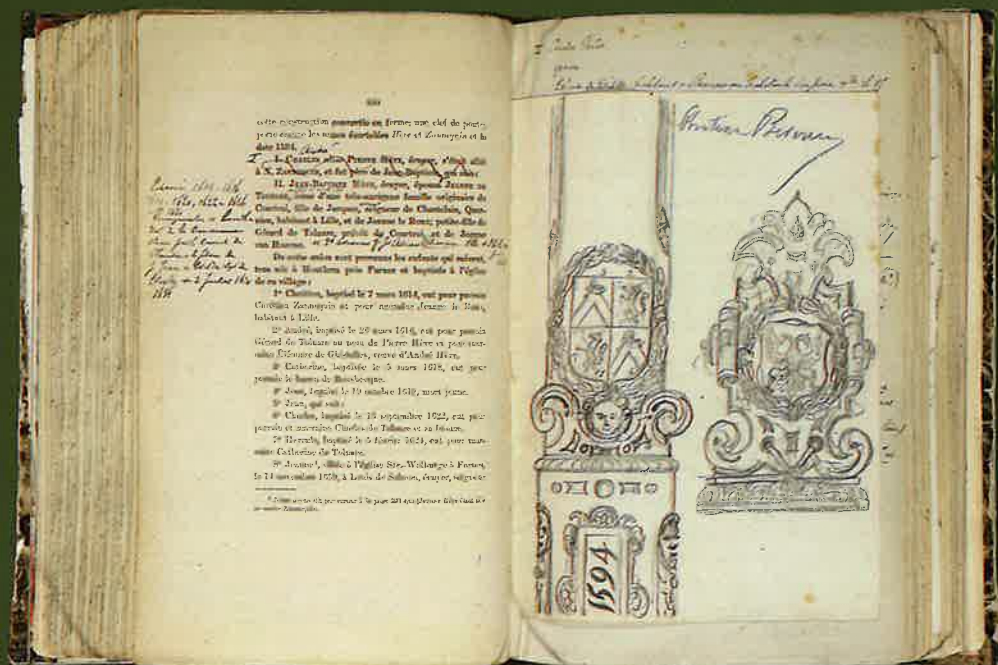
Pagina 460 uit Recueil de généalogies inédites de Flandre, geannoteerd door Merghelynck zelf. Op de tegenover liggende bladzijde staan potloodtekeningen van wapenschilden (1594) uit Château Beveren.