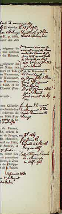
Exemplaar van Bruges en correcties aan de familie van